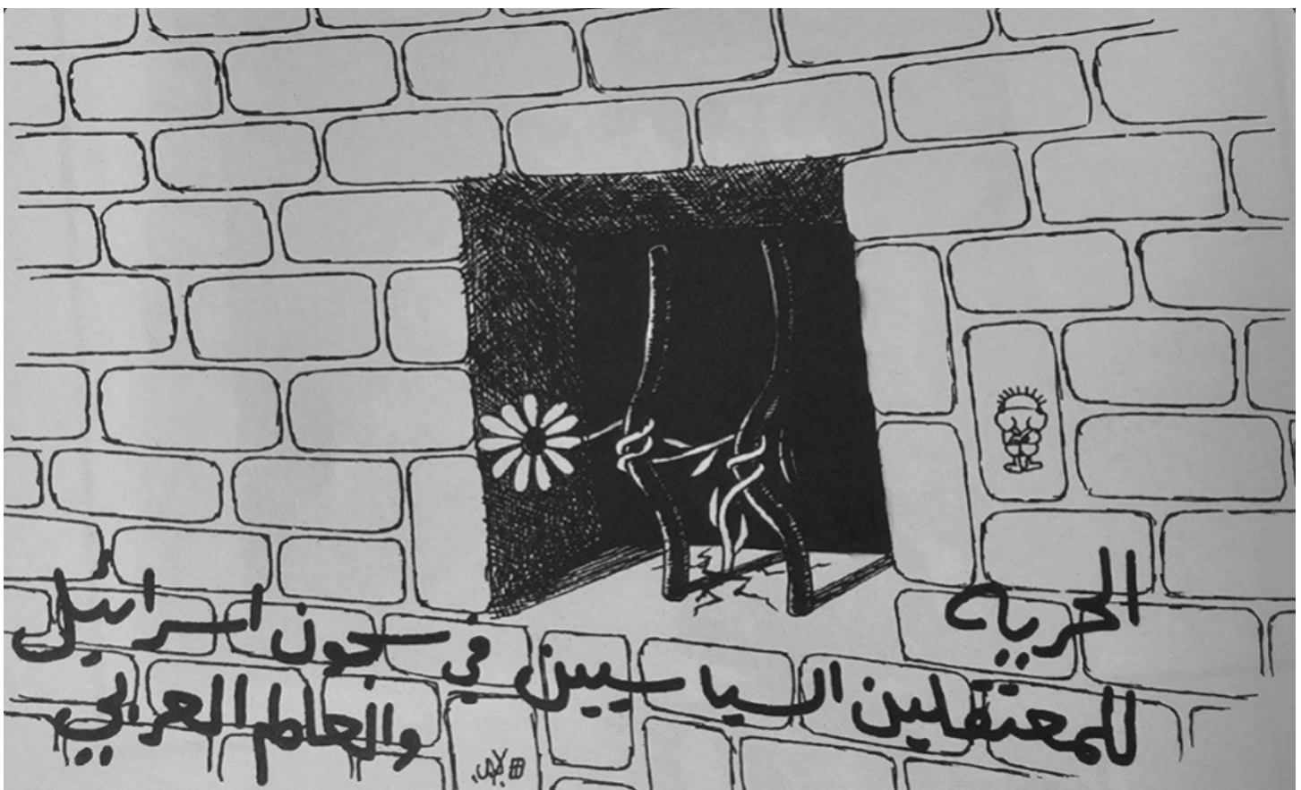
“Libertad para los prisioneros políticos en las prisiones de ‘israel’ y en el mundo Árabe.” Una flor dobla las rejas de una celda. (Diciembre 1979)

La prisión como ejemplo es el objeto de este estudio: perder la habilidad de interpretar la realidad, el sentimiento de impotencia y la pérdida de iniciativa no son destinos exclusivos de los presos; estas condiciones aplican a todos los palestinos. Las similitudes entre las condiciones de los ciudadanos Palestinos y las condiciones de los presos no son restringidas solo a la forma de opresión, como el hecho de que ciudadanos están separados por secciones geográficas similar a como los prisioneros son aislados el uno al otro